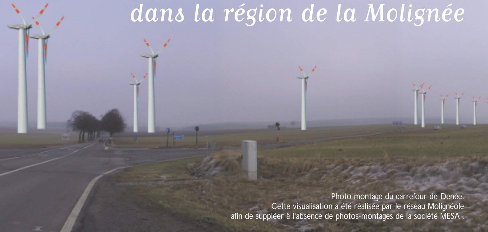
Photo-montage du carrefour de Denée. Cette visualisation a été réalisée par le réseau Molineeole afin de suppléer à l'absence de photos-montages de la société MESA .