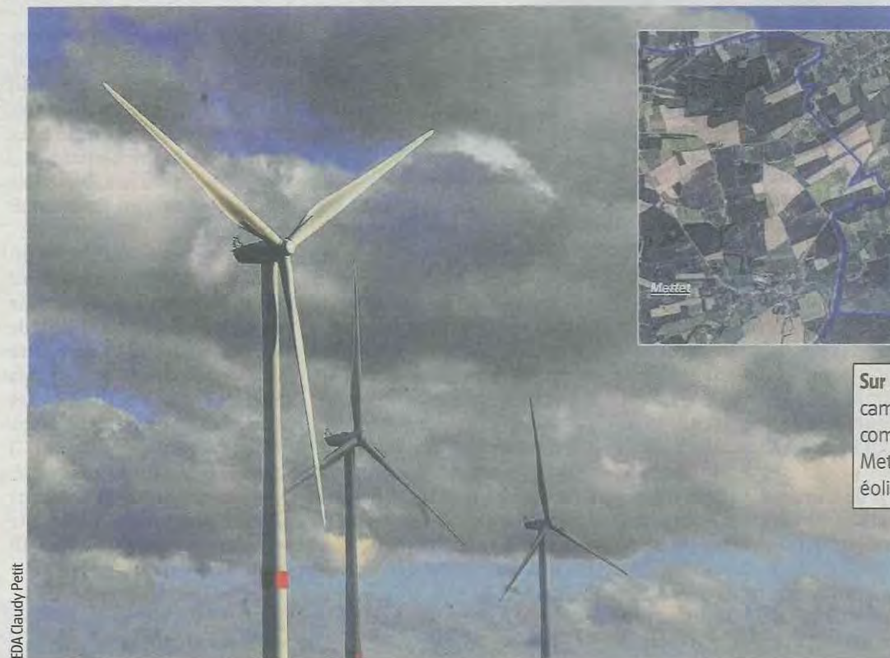
EDA Claudy Petit

Pour rappel, le promoteur prévoit d'implanter cinq éoliennes d'une hauteur de 150 m au carrefour de trois villages : Lesve bien sûr mais aussi Bésinne et Saint-Gérard. «Le parc produira environ 35 000 000 kWh par an, indique-t-on chez Luminus. Ce qui correspond à la consommation